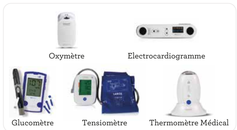
Option : Kit de télémedecine

Vous souhaitez contacter l'équipe Telegrafik, appelez au 05 82 95 50 52 ou écrivez à contact@telegrafik.eu